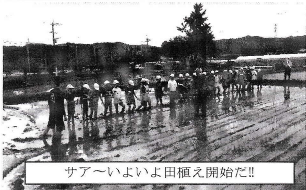
サア〜いよいよ田植え開始だ!!