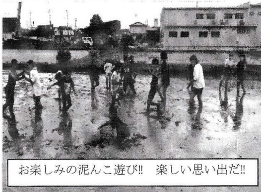
お楽しみの泥んこ遊び!! 楽しい思い出!!