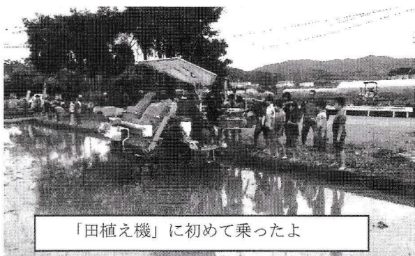
「田植え機」に初めて乗ったよ